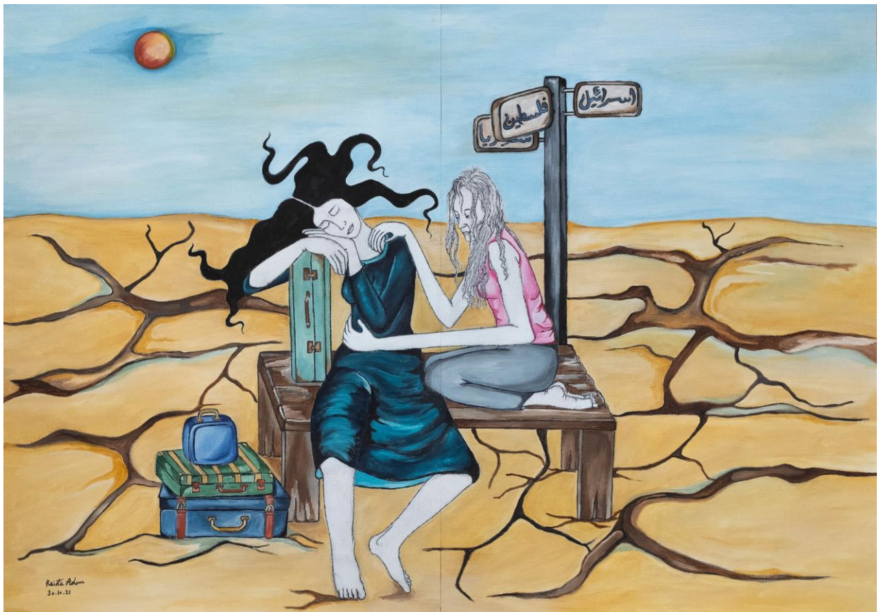
ראידה אדון, לאן, 2021, צבעי מים על נייר קנבס, 60 × 85 ס"מ.

בהשוואה לחליווה, שבו ההיברידיות מערערת את גבולות הפריים הדיגיטלי, ואצל שחאדה, שבה היא מתרחשת באנטומיה עצמה, אצל אדון היא מתמקמת ביחסים בין גוף לנוף. הגוף כמעט ואינו משתנה; המתח מתרחש במרחב הסובב אותו. ה־ Third Space אינו רגע מעבר חולף אלא צורת חיים מתמשכת - נשיאה של מטען, החזקה של חוט, ישיבה בצומת שאינו מוכרע.