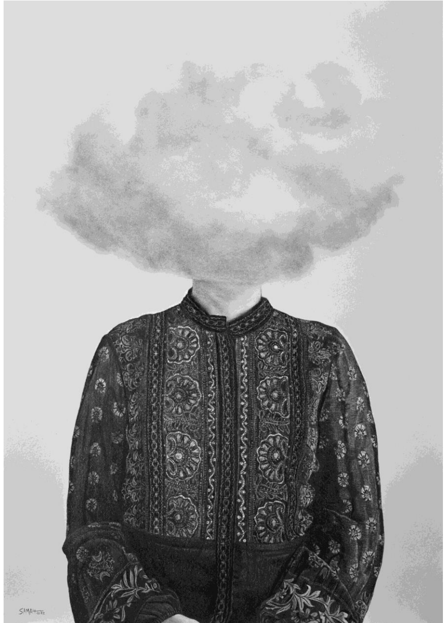
סמאח שחאדה, Cloudhead , 2022, פחם על נייר, 70 × 50 ס"מ.