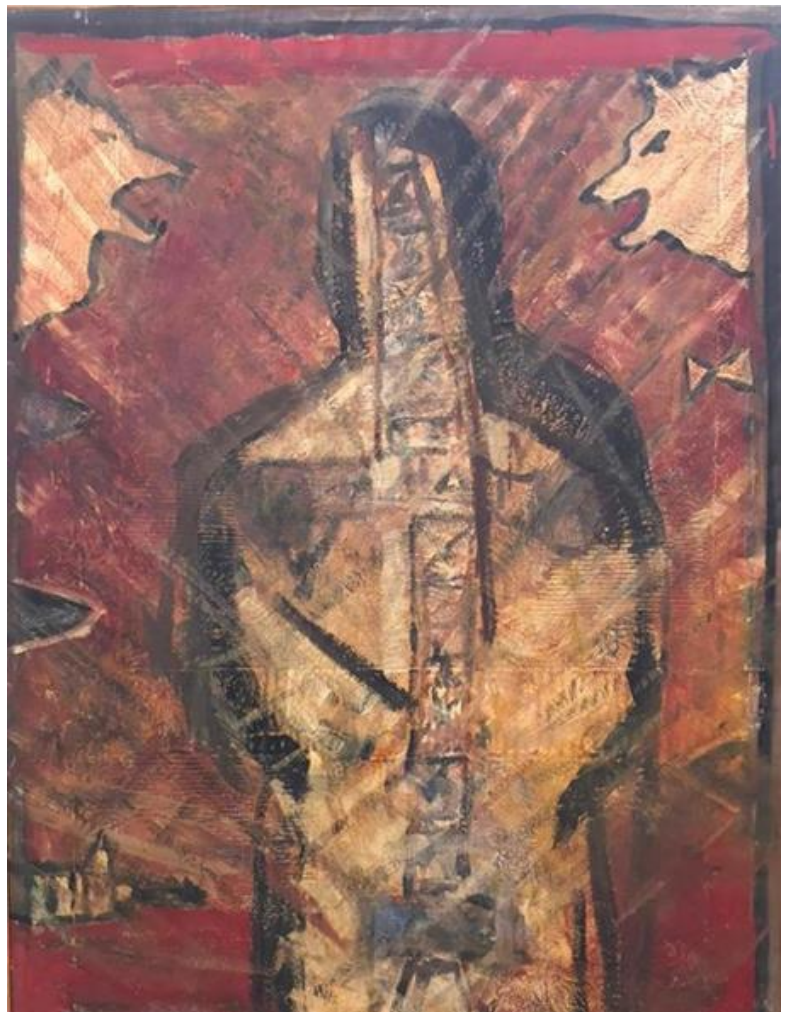
בשיר אבו־רביע, איש עם זאב , 2006, שמן על בד, 140 × 100 ס"מ.

ההיברידיות אצל אבו־רביע אינה אלגוריה ישירה של זהות כפולה ואינה ערבוב סמלי מוצהר. היא מתרחשת ברמת המבנה החומרי של הציור עצמו. הגוף אינו מתפרק, אך גם אינו נסגר; הנוף אינו רק רקע, אך גם אינו סובייקט עצמאי. הדימוי מוחזק במצב מתמשך של אי-התכנסות-כארגון חזותי שבו הזהות אינה מוכרעת ואינה נעלמת, אלא מתקיימת כמתח פעיל ומתמיד.